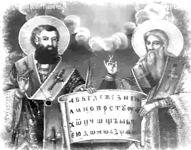
St Cyril & St Methodius 2月14日

二人学问渊博，都是神学家及语言学家，熟谙斯拉夫语。他们在希腊字母的基础上创造了斯拉夫字母，把新经、古经和礼节书等译成斯拉夫语，以便该族人民传诵和学习。现代斯拉夫语系诸语，如俄语、保加利亚语、斯拉夫语均采用这种文字。简明不列颠百科全书416页，对二圣和他们所创造的字也有较详尽的介绍，这是教会对世界文化的发展做出巨大贡献的又一例证。